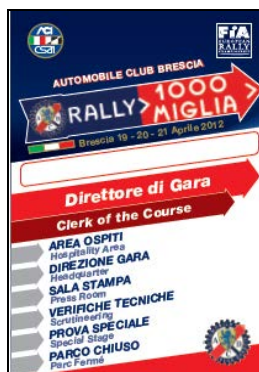
Direttore di Gara