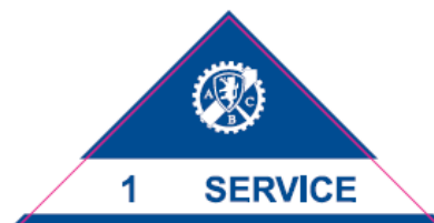
Pass auto "Service"