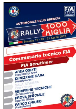
Comm. Tecnico FIA