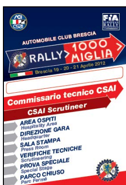
Comm. Tecnico CSAI