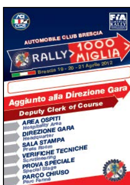
Aggiunto Dir. Gara