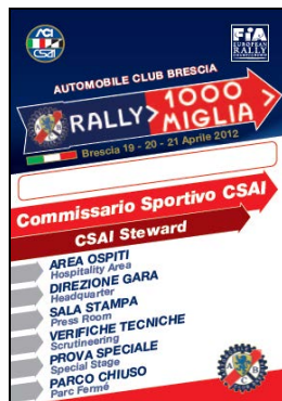
Comm. Sport. CSAI