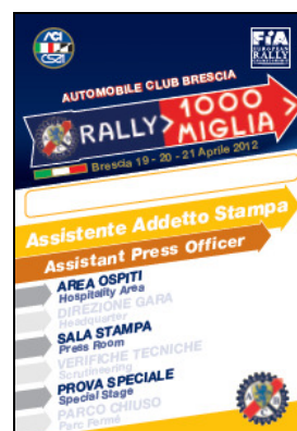
Ass. Addetto Stampa