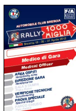
Medico di gara