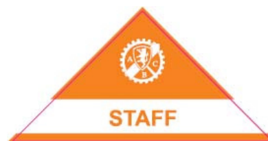
Pass auto "Staff"