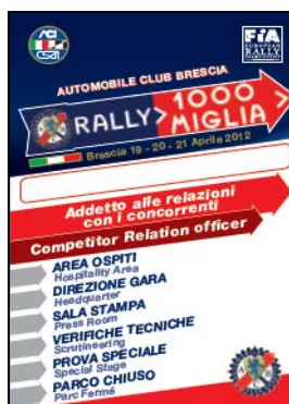
Add. Rel. Conc.