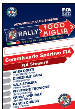
Comm. Sport. FIA