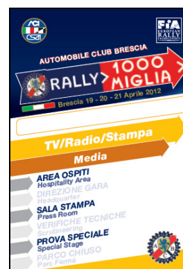
Media (TV / Radio)