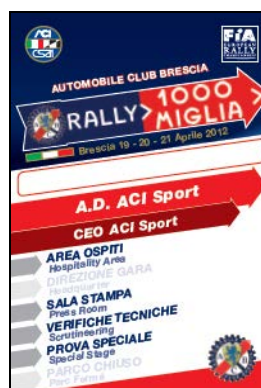
A.D. ACI Sport