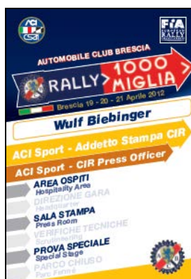
Addetto Stampa CIR