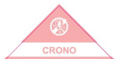
Pass auto "Crono"