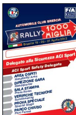
Del. Sicurezza CIR